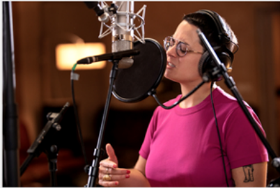
Pumpkin : rap